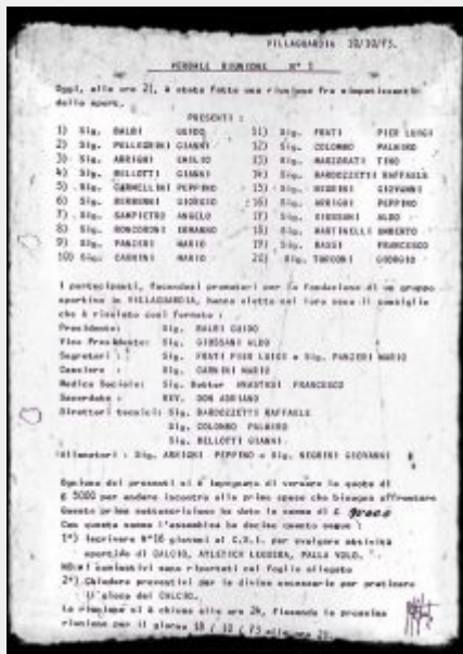
Il verbale della prima riunione ufficiale del GSV

A distanza di 45 anni il Gruppo Sportivo Villa Guardia è decisamente cresciuto, raggiungendo una dimensione decisamente importante, con oltre 1000 sportivi e supporter arruolati, la maggior parte dei quali giovani tesserati per le varie squadre iscritte nelle differenti discipline sportive. Otto le sezioni oggi presenti: Atletica, Basket, Calcio, Ciclismo, Montagna (Sci, Escursionismo e Arrampicata), Tennis, Tennis tavolo e Volley per una realtà che al momento è tra le più importanti della Lombardia in quanto a dimensioni e proposte sportive.