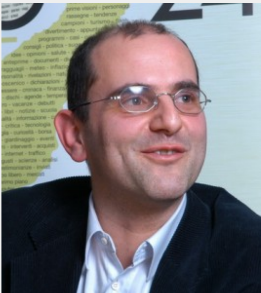
Alberto Pellai, psicoterapeuta e autore di successo

Tra i temi più delicati che riguardano e travolgono la preadolescenza, il corpo e la relazione sono in primissimo piano.